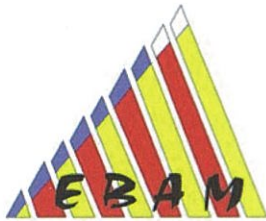
Escuela Balear de Actividades de Montaña (Federación Balear Montaña y Escalada)

Asimismo la AEGM tiene acuerdos de colaboración con :