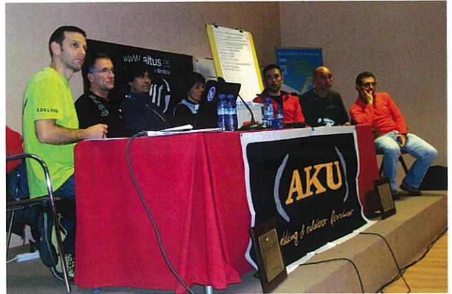
Reunión constitución Junta Directiva